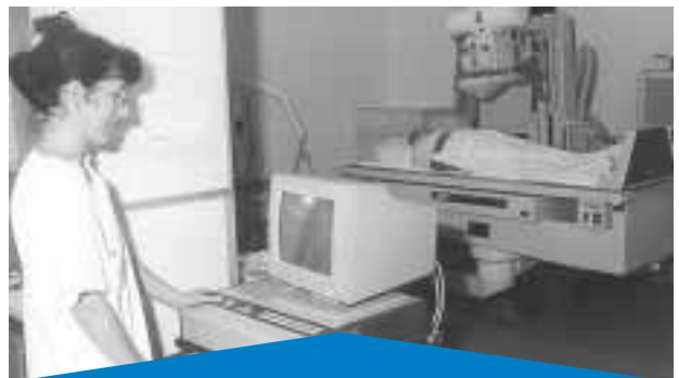
Une salle de soins

de balnéothérapie ou de cryothérapie. Ces séances durent moins d'une heure et pour certains patients cela suffit largement à remplir la matinée, la fatigue étant toujours omniprésente dans cette maladie ! Le reste de la matinée est bien souvent occupé à se reposer jusqu'au repas de midi, pris lui, avec tous les résidents dans la grande salle de restaurant du bâtiment d'accueil. Une petite sieste si besoin après le déjeuner et puis direction les locaux de l'ergothérapie où l'on fera travailler ses mains, sa mémoire et son raisonne-