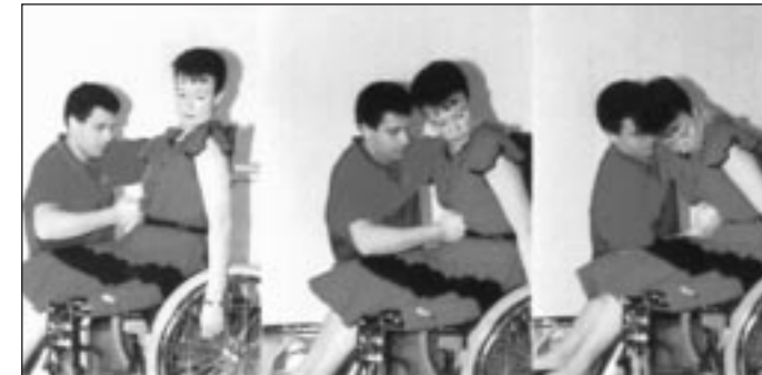
Manœuvre effectuée sur une personne en fauteuil roulant.