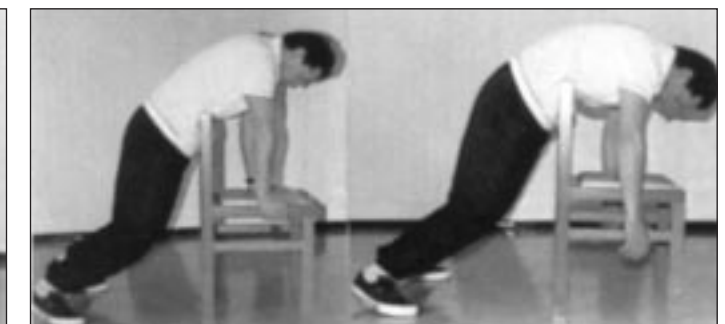
Manœuvre effectuée sur le dos d'une chaise.

LE GESTE PEUT ÊTRE AUSSI BIEN EFFECTUÉ PAR UNE TIERCE PERSONNE FÉMININE