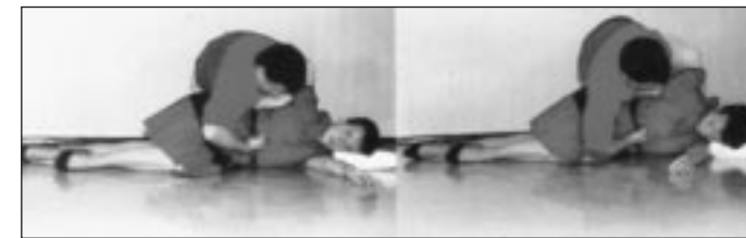
Manœuvre effectuée sur une personne allongée.