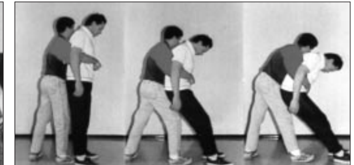
Manœuvre effectuée sur une personne debout.